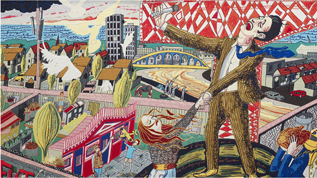
Resim 3. “The Agony in the Car Park” (Otoparkta İstirap)

Çıkmazda” ve “Ağıt” adlarını taşıyan büyük boy halılar, İngilizlerin zevk ve sınıf düşkünlüklerinin izini sürmekte ve sergilemektedir. Tanınmış isimlerin malikânelerinde yer alan halıların dokunduğu Flanders’da üretilen bu halılar içerik ve renk bakımından oldukça zengin bir yapı sunmaktadır. Eserlerde, Birleşik Krallık’ta yaşamın, iç tasarımdan mutfığa, politik protestodan ünlü dedikodularına kadar her alanında, kendine has yanları ve de tuhaflıkları betimlenmektedir. Perry, kurmaca karakteri Tim Rakewell’in çocukluktan ergenliğe ve orta yaşlarındaki ölümüne kadar anlattığı hayatı üzerinden Birleşik Krallık’taki toplumsal sınıfların öne çıkan özelliklerini ve estetik algılarını ortaya koymaktadır. İngiliz toplumunun işçi sınıfı, orta sınıf ve üst-orta sınıf olmak üzere üç sınıfını, ikişer halıda resmedilmiş ikişer sahne ile ele almaktadır. Böylelikle Perry’nin son iki yüzyıllık dünya tarihinin en tartışmalı kavramlarından biri olan “sınıf” konusunda oldukça özgün bir yaklaşım sergilediği ve İngiltere’deki toplumsal sorunları ele aldığı görülmektedir. 34