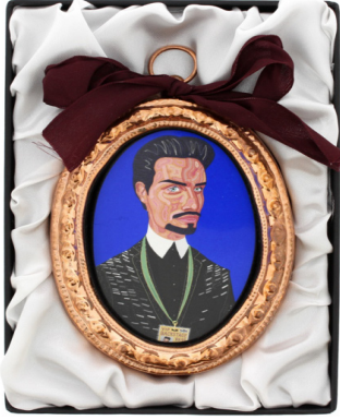
Resim 1. “The Earl of Essex” (Essex Kontu)

Perry'nin, ortak özellikleri kimliğini değiştiren veya kimliği değişen “sıradan insanları” oluşturan 2014 yılına ait 14 eserine bakıldığında, bunlar arasında Müslüman olan bir İngiliz kadın, cinsiyetini değiştiren ve erkek olan bir genç, iki eşcinsel babanın kurduğu bir aile, gözden düşen ve itibarını kaybeden bir politikacı, bir Alzheimer hastası bulunmaktadır. Perry, bu kişilerin her biriyle üç-dört gün geçirerek, onları anlamaya çalışmış ve duygu, düşüncelerini mini bir portreye, bir halıya, bir vazoya, ipek bir eşarba aktarmıştır.