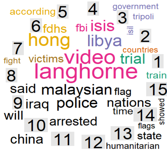
Figure 3. Most Common Words in These News